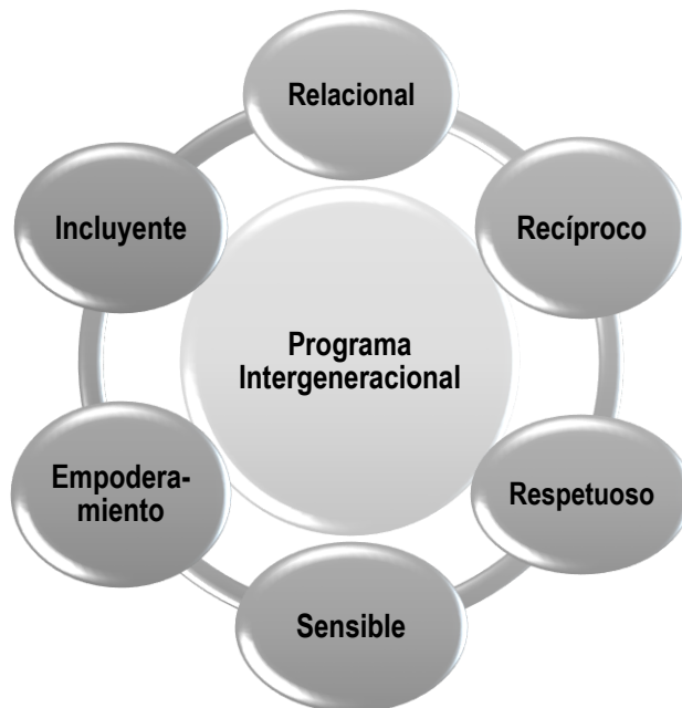
Figura 2. Elaboración propia con información de Generations United (2019)

Los programas y actividades intergeneracionales pueden variar significativamente de una comunidad a otra. Sin embargo, toda la programación de actividades intergeneracionales de alta calidad cuenta con las siguientes características clave ( Generations United , 2019):