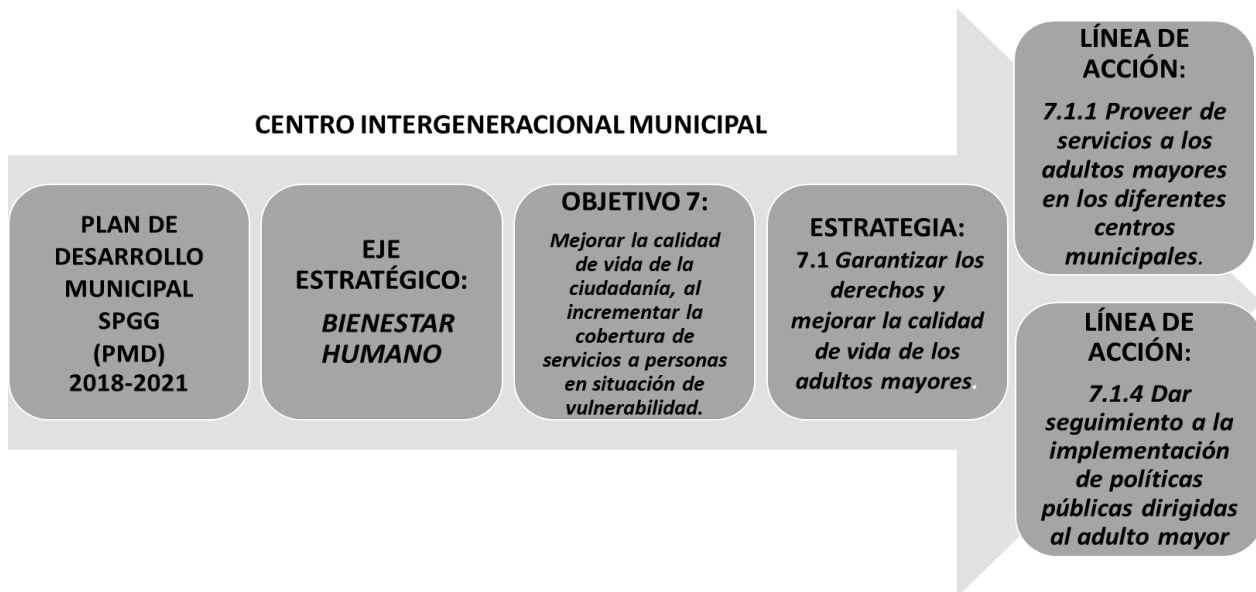
Figura 1. Elaboración propia. Plan Municipal de Desarrollo 2018-2021.

Las actividades y servicio del Centro Intergeneracional Municipal contribuyen con el Plan Municipal de Desarrollo (PMD) 2018-2021 en el eje de Bienestar Humano, con el objetivo 7: Mejorar la calidad de vida de la ciudadana, al incrementar la cobertura de servicios a personas en situación de vulnerabilidad ; con la estrategia 7.1 Garantizar los derechos y mejorar la calidad de vida de los adultos mayores ; y con las líneas de acción: 7.1.1 Proveer de servicios a los adultos mayores en los diferentes centros municipales y 7.1.4 Dar seguimiento a las políticas públicas dirigidas al adulto mayor .