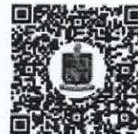
Tabulador de Sueldos para el ejercicio 2022